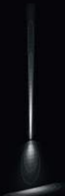
1x blade 4°x17° + 1x D 21°x19° Medium Beam