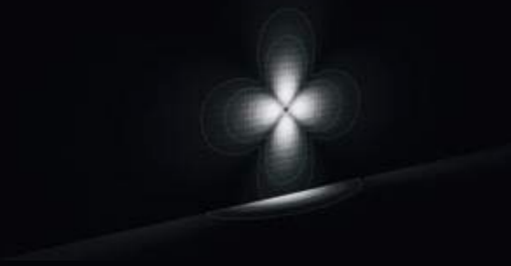
4x D 50°x20° Wide Beam