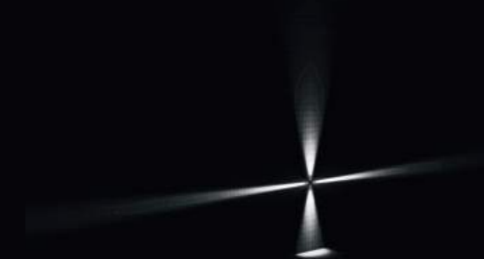
2x blade 4°x17° + 2x D 21°x19° Medium Beam