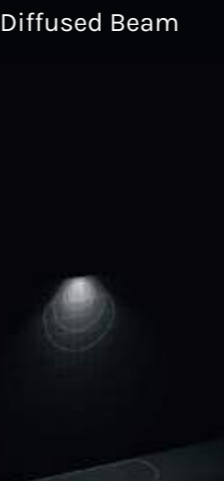
1x U-D 100°x60° Diffused Beam