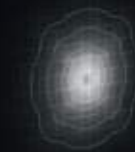
U-D 100°x60° Diffused Beam