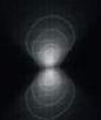
2x U-D 100°x60° Diffused Beam