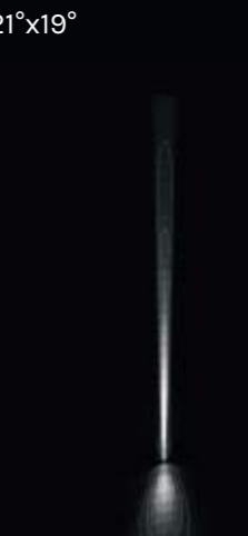
1x blade 4°x17° + 1x D 21°x19° Medium Beam