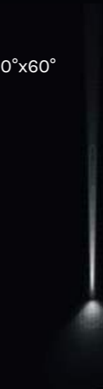
1x blade 4°x17 + 1x U-D 100°x60° Diffused Beam