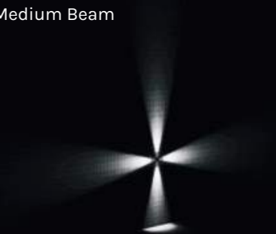
4x D 21°x19° Medium Beam