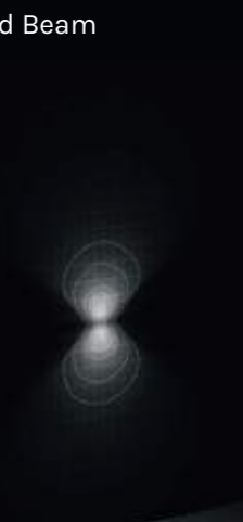
2x U-D 100°x60° Diffused Beam