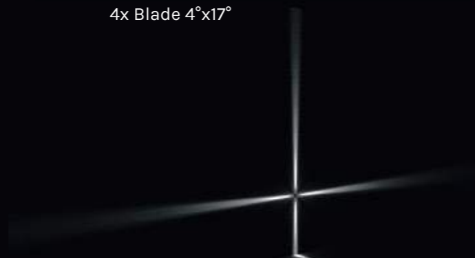
4x Blade 4°x17°